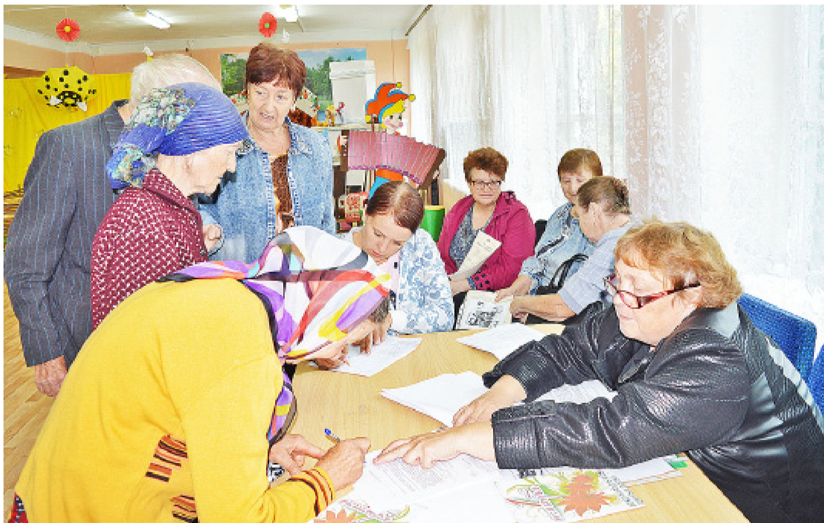
Участники районной акции поздравили пенсионеров села Яровского с приближающимся Днём пожилых людей

В Казанском районе в рамках месячника «Пусть осень жизни будет золотой» проходит акция «Поезд добра». Её инициатор – комплексный центр социального обслуживания населения. Суть акции – оказание необходимых услуг гражданам в возрасте «65 +».