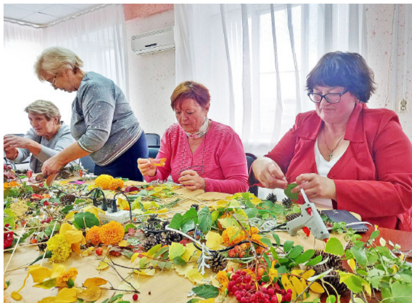
Женщины увлечённо занялись работой, каждое панно получилось оригинальным

водим информационные и праздничные мероприятия, устраиваем выставки даров природы. В нашем районе живут трудолюбивые, творческие, с хорошей выдумкой женщины, поэтому выставки всегда очень интересные и не похожи одна на другую.