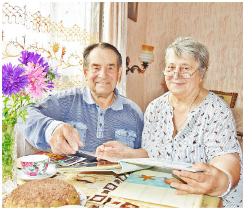
Супруги любят смотреть старые фотографии, вспоминать историю создания своей семьи