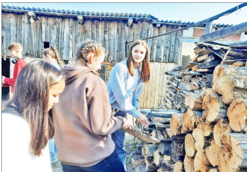
Весело и дружно поработали ребята из Новоселезнёвской школы