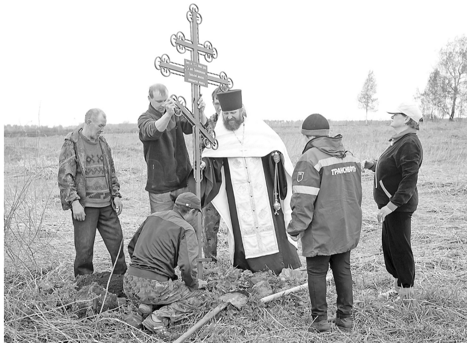
Установка поклонного креста в окрестностях деревни Девятково.

Из разных мест российских шли и шли сюда паломники на поклонение к иконе Святого великомученика Пантелеймона, впитать небесную благодать от чудодейственных сияний, происходящих с небес. Попросить Божьей помощи от засушливого лета или от обильных дож-