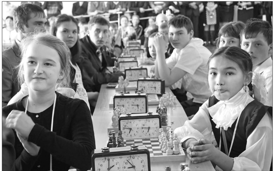
Участники шахматно-шашечного турнира