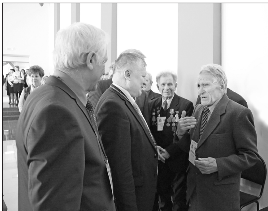
Анатолий Карпов встретился с ветеранами