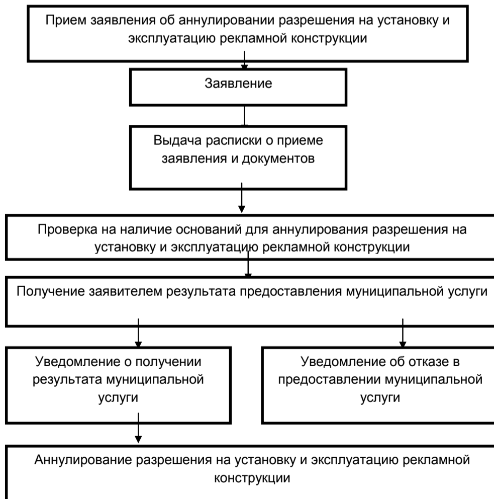
Приложение № 5 к Регламенту