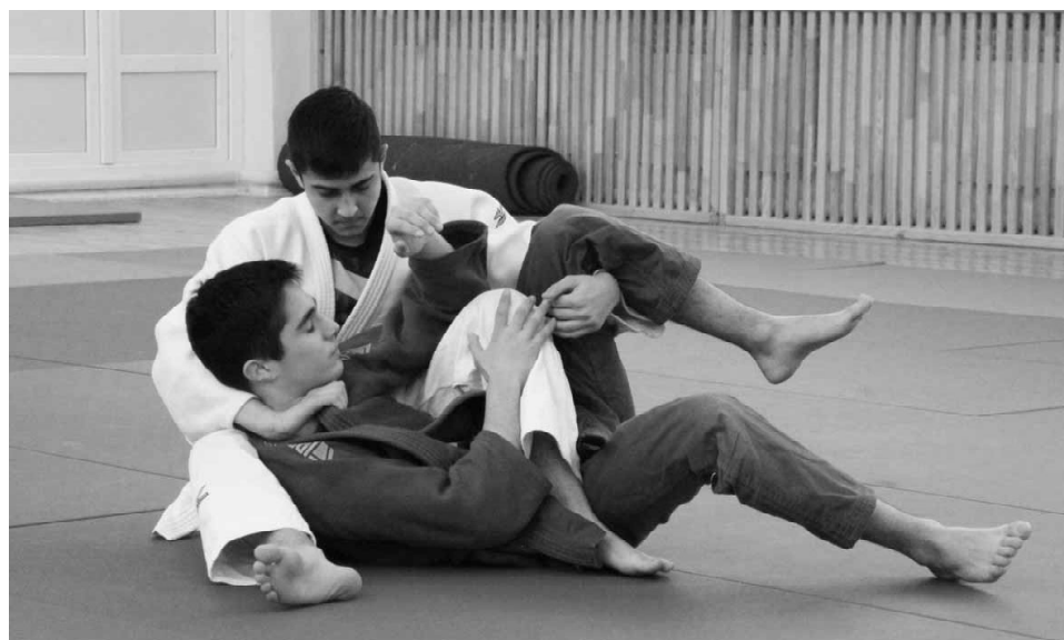
Воспитанники Центра олимпийской подготовки «Тюмень-дзюдо»: момент тренировочной схватки