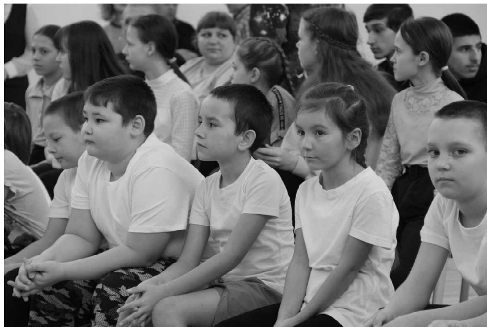
Учащиеся школы с интересом смотрят показательный мастер-класс