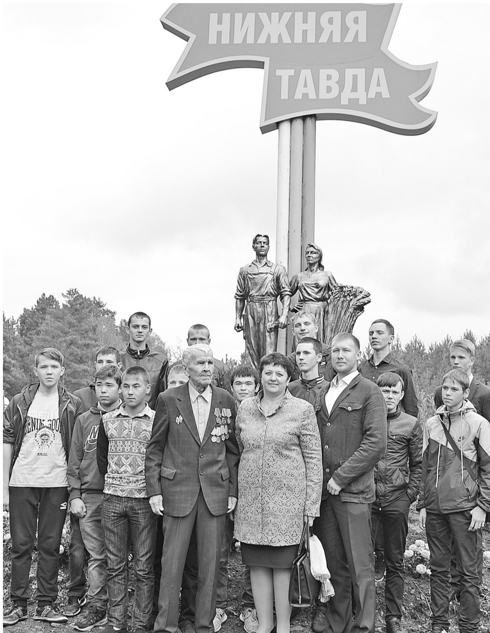
На открытии памятника.