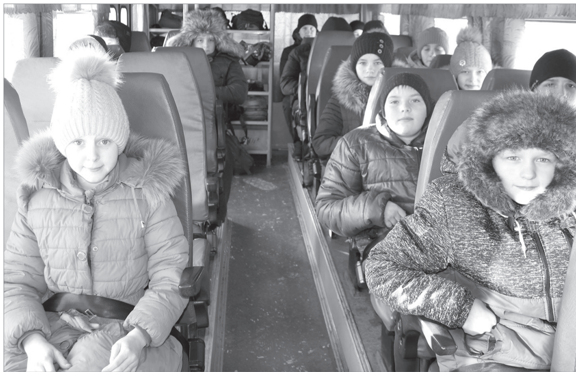
Из Хохловской школы криволюкских ребят и раньше возили, соблюдая все правила. Теперь контроль за безопасностью стал ещё строже