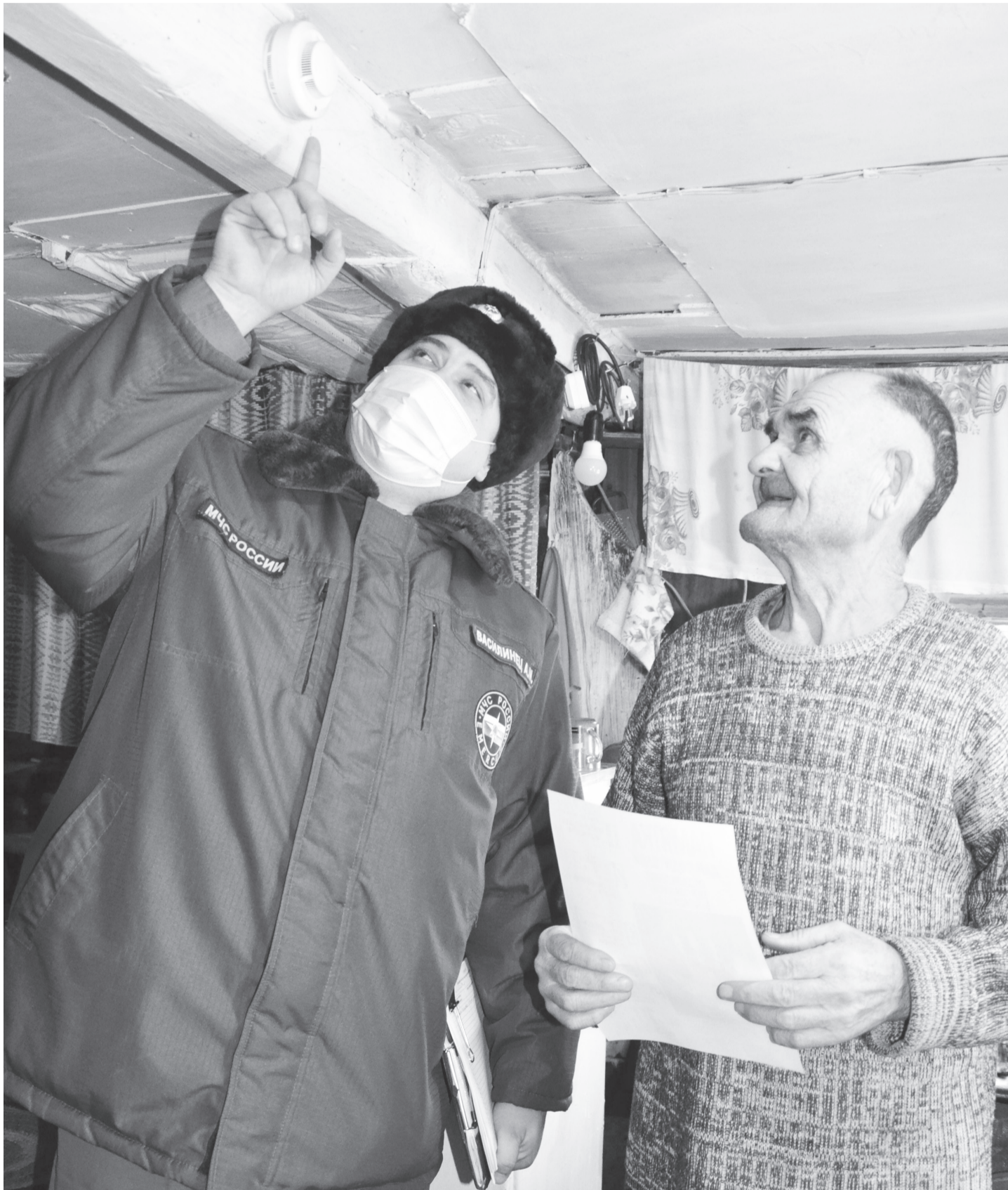
В каждом доме должен быть пожарный извещатель.