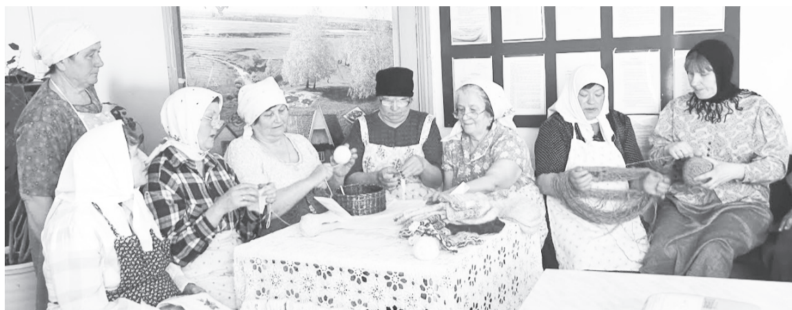
Женщины из клуба «Серебряная нить» представляют инсценировку, посвящённую жизни в тылу во время войны.