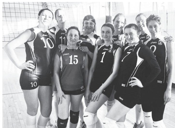
Упоровская команда волейболисток пополнила копилку медалей.