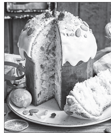
После поста разговеться куличом

Готовим. Муку просейте, заварите кипящим молоком и тщательно размешайте, охладите до температуры парного молока. Введите распущенные в небольшом количестве молока вспенившиеся дрожжи, поставьте в тёплое место, дайте тесту подняться. Добавьте желтки, растёртые с сахаром до бела, перемешайте. Добавьте белки, взбитые в стойкую пену, перемешайте и поставьте в тёплое место, чтобы тесто поднялось вторично. Влейте растопленное тёплое сливочное масло, выберите тесто как можно лучше, поместите в смазанную размягчённым маслом, подпылённую мукой форму, заполнив её до половины. Когда тесто поднимется вровень с краями формы, поверхность смажьте желтком. Выпекайте при температуре 180 градусов до готовности. Готовый кулич украсьте орехами, цукатами и глазурью.