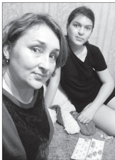
Играем в настольные игры

Добровольная самоизоляция у всех проходит по-разному. Кто-то впал в уныние, а кто-то сразу составил список фильмов и книг. Мы не задаёмся вопросом, когда это всё закончится, – просто учимся жить в новых условиях. Жители района поделились, как это у них получается.