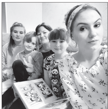
Пересматриваем семейный альбом