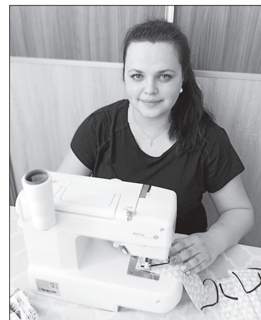
Занимаюсь своим любимым делом