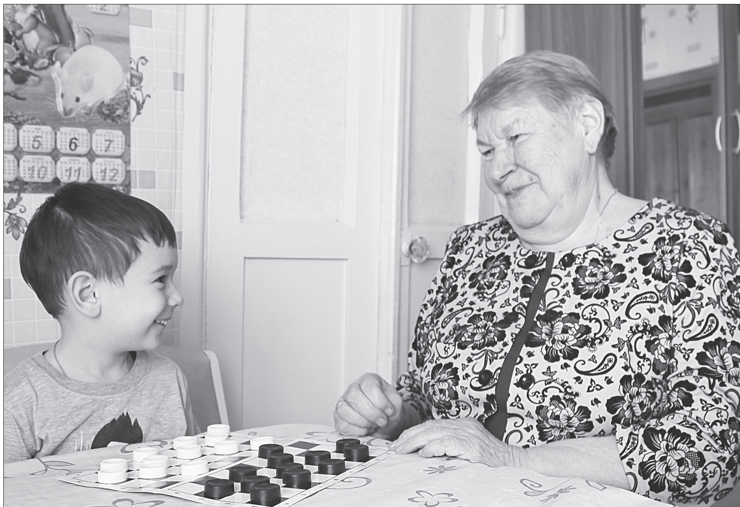
Ничего не может быть лучше живого общения с родными. Сыграть в шашки? Легко!

По материалам оперативного штаба Тюменской области по профилактике коронавируса