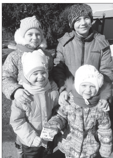
Гуляем раз в день возле дома

– В каждом режиме есть свои плюсы – когда бы ещё так долго жила в гостях тюменская внучка, если бы в городе работал детский сад? Сейчас у нас весело – четверо детей от пяти до одиннадцати лет. Что делаем? Учимся на удалёнке разными способами, и знаете, мне самой интересно, да и полезно вспомнить школьную программу, посмотреть видеоролики. Ещё много рисуем, раскрашиваем, играем в настольные игры. Правда, гораздо реже выходим погулять перед домом – всего раз в день. Недавно на дороге нарисовали мелом классики – до 150! Прыгали все, даже проходящие мимо тётки! Из-за последнего снегопада у ребят, как и у взрослых, прибавилось забот. У меня все дела обычные, «домохозяйские». Всё внимание – детям. А ребята соскучились по друзьям, им хочется в школу и садик.