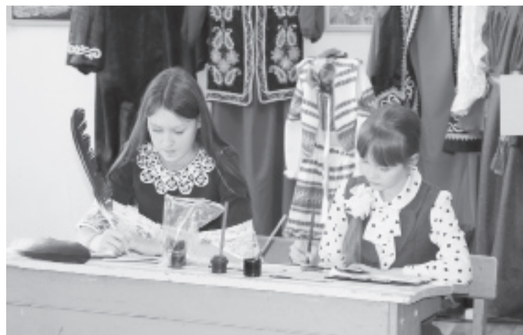
|| Бархатовцы показали, как учились дети в старину.