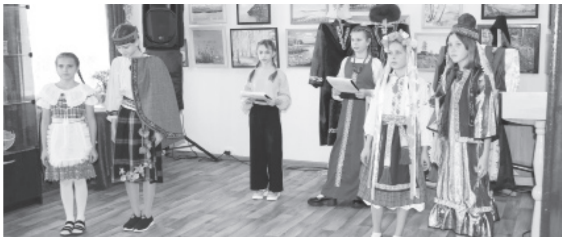
|| Слободабешкильские школьницы рассказали о народах, проживающих в их поселении