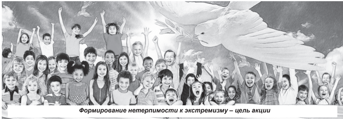
Формирование нетерпимости к экстремизму – цель акции

Всероссийская оперативно-профилактическая акция «С ненавистью и ксенофобией нам не по пути» проходит с 17 по 26 ноября.