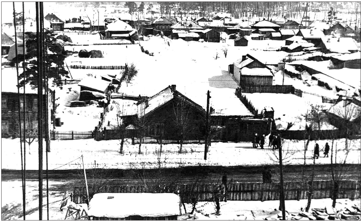
Так выглядела улица Первомайская в Заводоуковске семь десятилетий назад.

Более столетия оно оставалось довольно крупным, но не самым большим, селом Ялutorовского уезда, уступавшим, к примеру, Новой Заимке. Всё изменилось после того, как в 1913 году по нашему краю прошла железная дорога. Тогда на ней появилась и станция Заводоуковская. Четверть века рядом