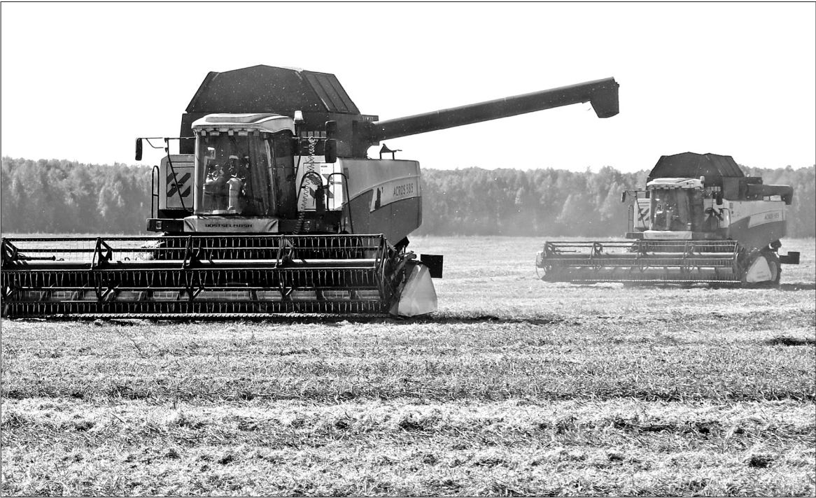
■ На счету аграриев городского округа немало достижений и побед, завоёванных трудом и профессионализмом.

Агропром. В Заводоуковске подвели предварительные итоги сельскохозяйственного года