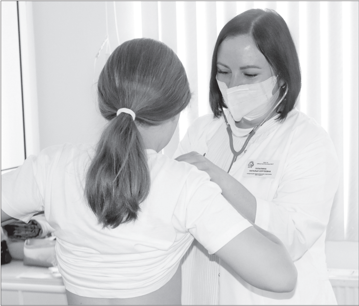
■ С таким добрым доктором маленьким пациентам никакие болячки не страшны.

Первый блин. На всю жизнь ей запомнился её первый пациент. Студентка проходила практику в первой городской поликлинике. Медсестра зачем-то вышла из кабинета, и тут приходит папа с ребёнком. – Говорит мне: «Здравствуй-