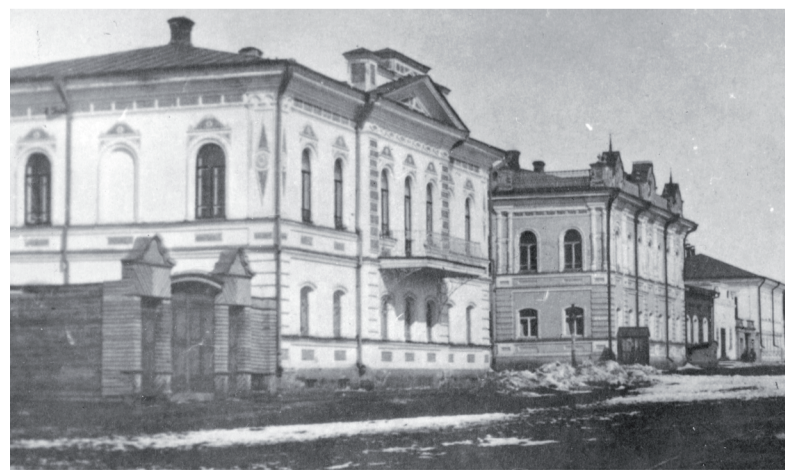
Дом Бокарёвых на углу Базарной площади и Бокарёвской улицы. 1911 г.