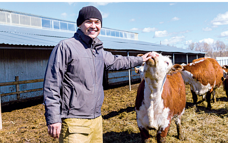
Президент РФ предложил меры поддержки среднего и малого бизнеса

И президент РФ предложил полностью списать пострадавшему бизнесу налоги за второй квартал. По словам Путина, будет работать принцип не отсрочки, а полной отмены налогов и страховых взносов (кроме НДС) за второй квартал текущего года (апрель, май и июнь), т.е. «за те месяцы, когда бизнес оказался и будет ещё находиться в сложной ситуации». Мера распространяется на индивидуальных предпринимателей, на компании малого и среднего бизнеса в пострадавших отраслях и на социально ориентированные некоммерческие организации (СОНКО). Также Владимир Путин предложил с 1 июня запустить специальные зарплатные кредиты под 2% на поддержку занятости в пострадавших предприятиях (в