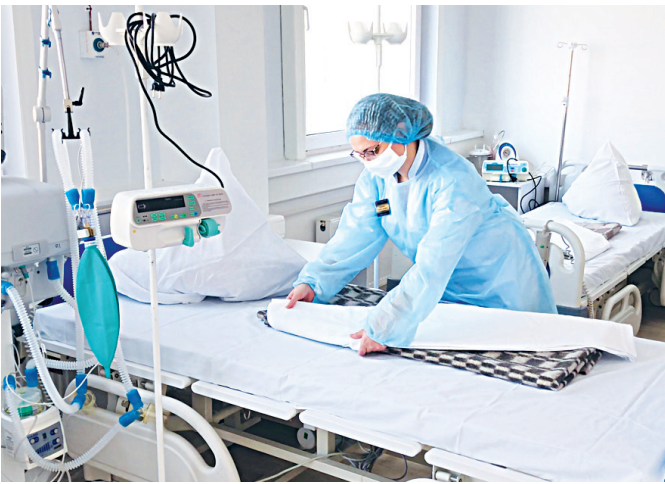
Готовы к приёму пациентов

В новом пакете «президентских» мер поддержки бизнеса нашлось место и самозанятым (это новая категория граждан, которые не имеют статуса ИП, но официально уплачивают налог на про- фдоход 4% и занимаются своим делом). По предложению главы государства, самозанятым вернут налог на доход за 2019 год и предоставят налоговый вычет в размере МРОТ для налоговых