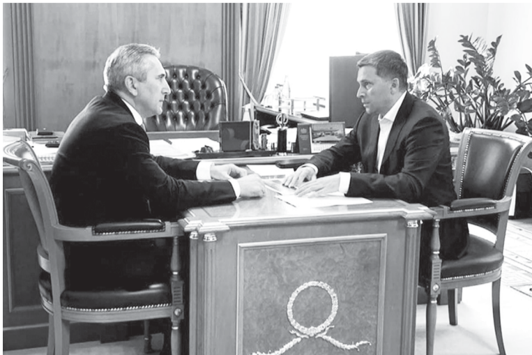
Моменты встречи Александра Моора с Дмитрием Кобылкиным

Более 6,5 тыс. газопроводов-вводов к жилым домам и 247 км газовых сетей планируется построить в Тюменской области в 2021 году, на газификацию населённых пунктов в регионе направлено 542 млн рублей, как сообщает ИА «Тюменская линия».