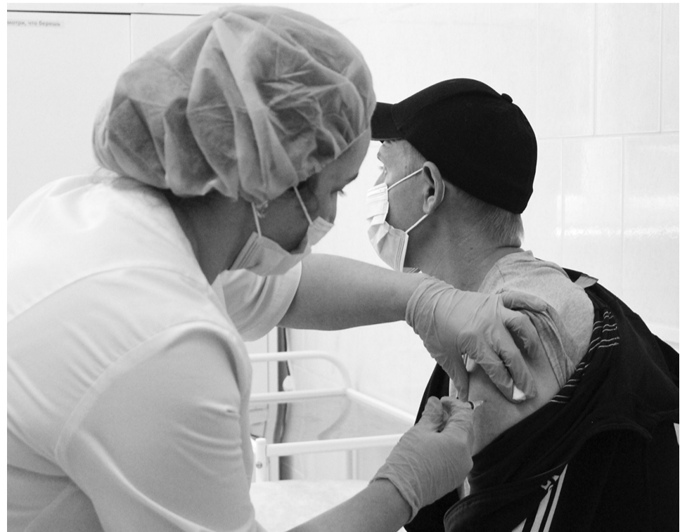
В больнице вакцинируют всех желающих

Нельзя недооценивать это. К остаточным последствиям после перенесённой пневмонии относят общие симптомы: утомляемость, боли в суставах и мышцах, длительное повышение температуры тела, поражение органов дыхания (одышка, кашель), расстройство сердечно-сосудистой системы, боли в груди, учащённое сердцебиение, поражение нервной системы (развитие тревожности, депрессия, нарушение сна, обоняния,