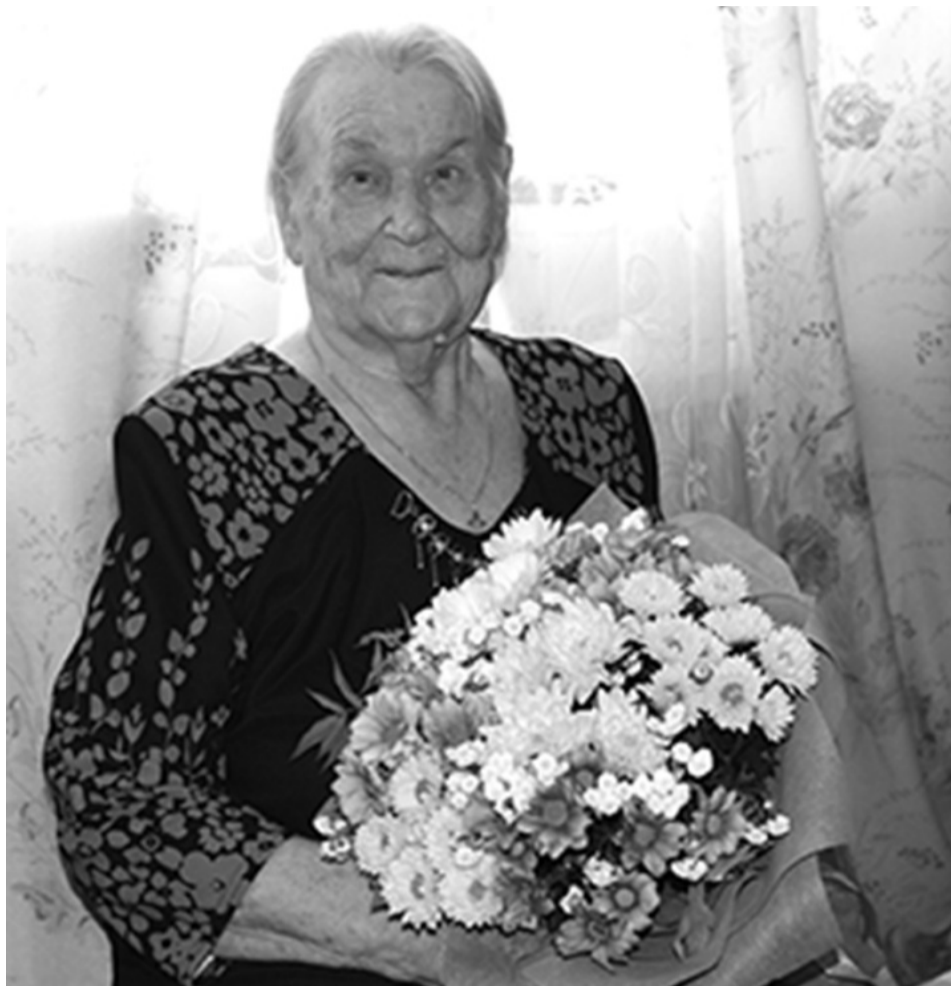
Юбиляр принимала цветы и поздравления