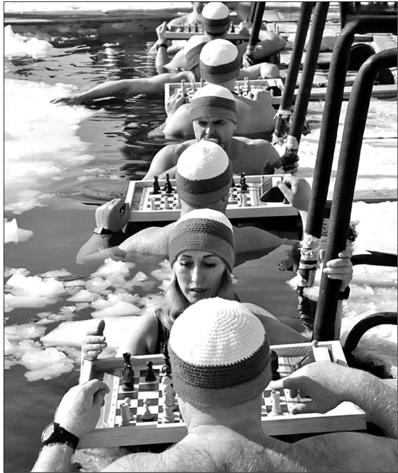
Первый в России блиц-турнир по шахматам в ледяной воде прошёл в Тюмени.