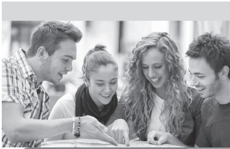
Привилегии для студентов в рамках программы лояльности «РЖД Бонус»