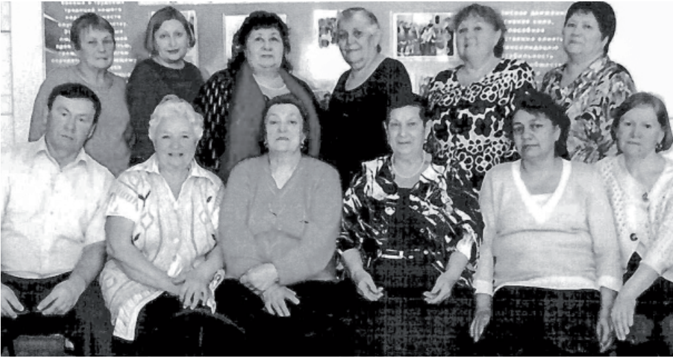
За добросовестную общественную деятельность первичная организация стоматологической поликлиники награждена почётными грамотами и благодарственными письмами губернатора Тюменской области, председателя Тюменской областной думы, председателя Ишимской городской думы, председателя городского совета ветеранов.