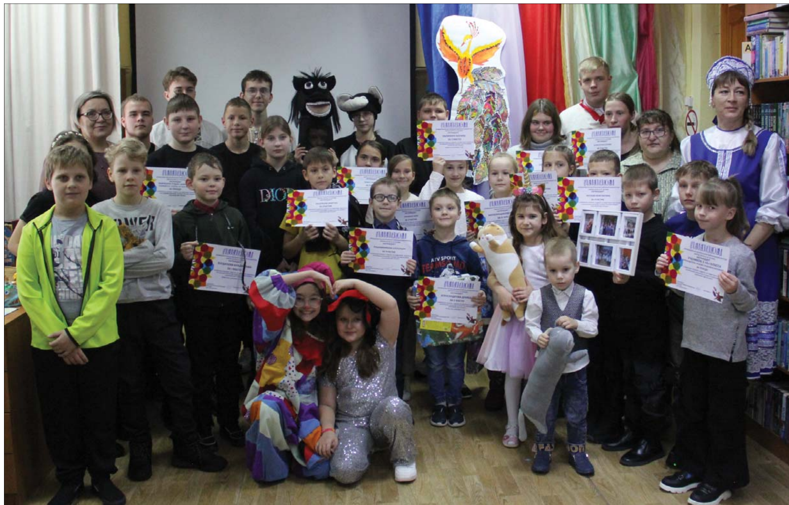
• По традиции – общее фото участников творческого мероприятия.