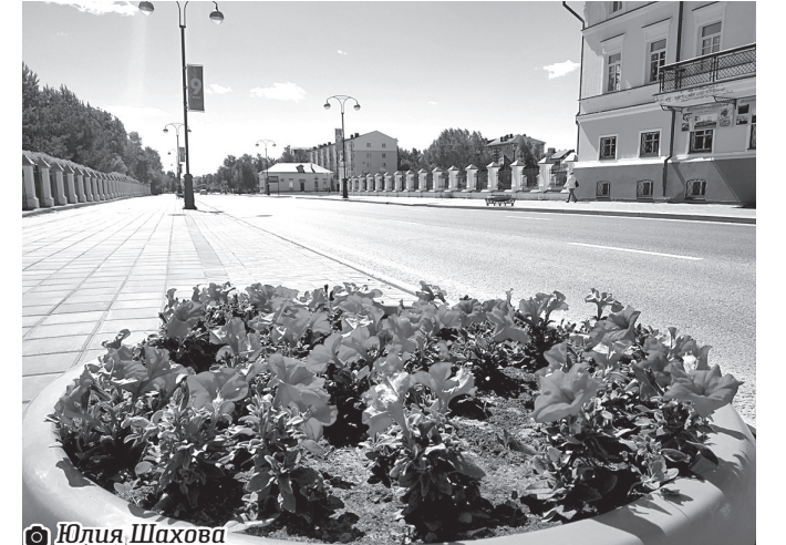
☞ Юлия Шахова

Кроме того, по словам Юрия Вавакина, в Тобольске в разных частях города установлено 227 цветочных вазонов, к уже имеющимся топиариям в этом году до-