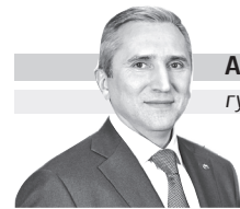
АЛЕКСАНДР МООР губернатор Тюменской области

Уважаемые работники сферы образования и ветераны педагогического труда Тюменской области!