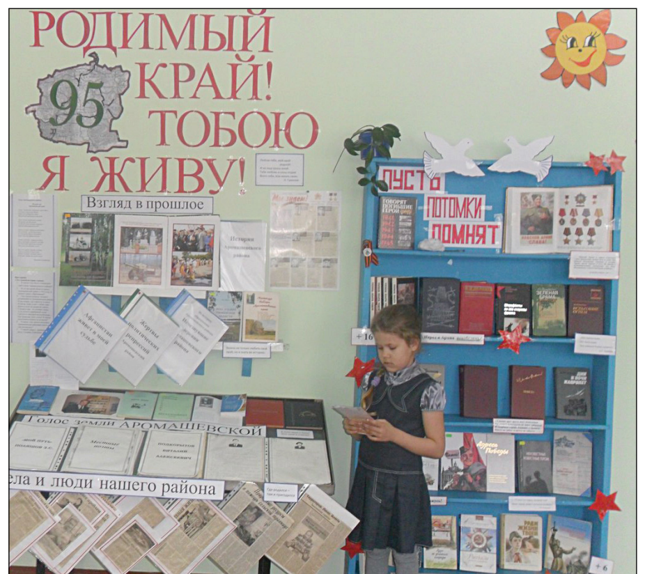
• На выставке каждый для себя сможет найти интересную информацию.