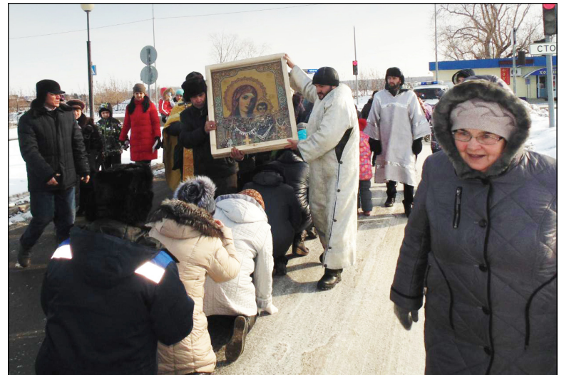
• Крестный ход с чудотворной иконой в селе Аромашево 25 марта 2018 года.

Закончить эту статью хочется батюшкиными словами, смысл которых прост и, в то же время, очень глубок: «С Богом везде хорошо. Где бы мы ни были, это – всё равно земля Божия!»