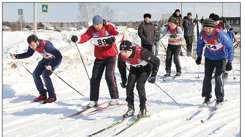
• Лыжные гонки – один из этапов сельских игр.

очко могло решить судьбу расположения всей команды в турнирной таблице. В развернувшейся борьбе за третье общекомандное место между сборными Новопетровского и Кармачского сельских поселений результат зависел от финальной игры в волейбол между сборными хозяев площадки и юрминской дружиной. На третью партию, ставшую особо зрелищной и самой напряжённой, команды вышли с равным счётом 1:1, и хозяева, завладев инициативой, оторвались далеко вперёд, доведя счёт до критического 13:7. Но просто так гости сдаваться не собирались. Проявив огромную волю к победе, они сумели переломить ход встречи и отыграть у соперника восемь безответных очков, победив со счётом 15:7. Таким образом, потерянное новопетровцами в волейболе очко в общем зачёте лишило их призового места по дополнительным показателям. В результате спортсмены из Новопетрово с кармачанами набрали по девятнадцать очков, но так как у новопетровцев было завоёвано одно первое место, а