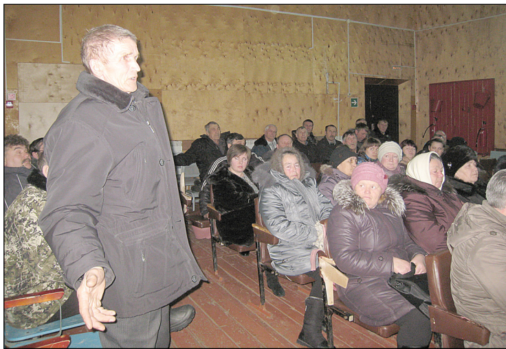
• На собрании пришли сельчане, у которых накопились вопросы и было стремление к участию в конструктивном диалоге.

– Мы должны с вами понимать, что, занимаясь решением тех или иных задач, необходимо не только соблюдать законодательство, но и придерживаться разумного принципа хозяйственной деятельности, – резюмировал глава района.