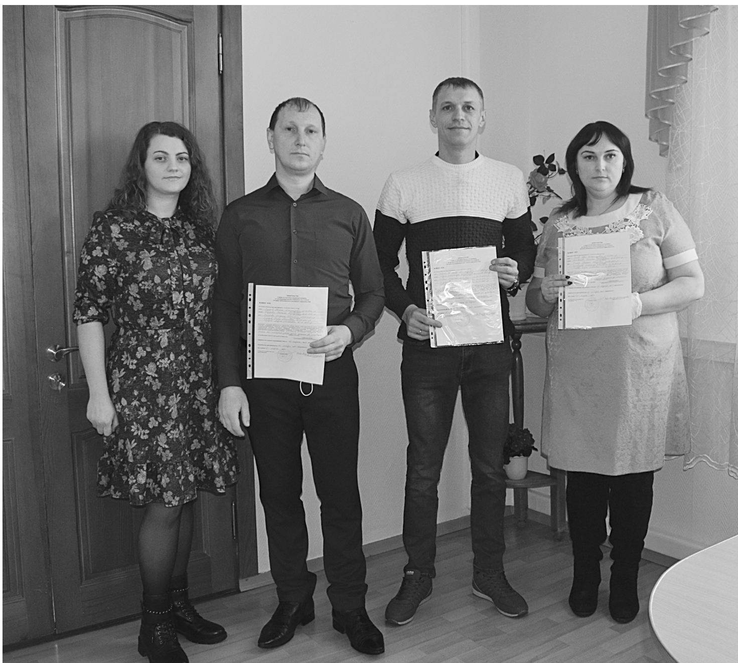
Теперь молодые семьи смогут погасить ипотеку