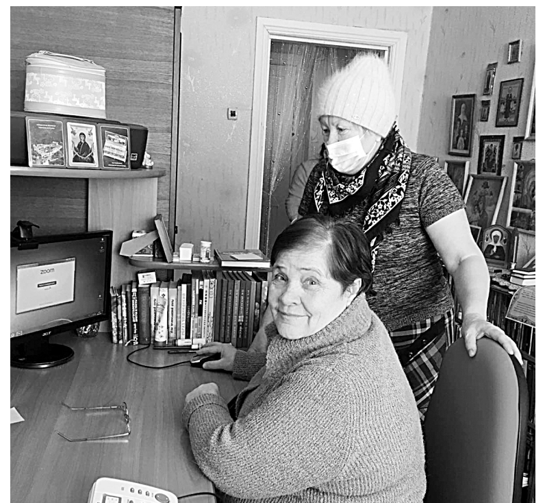
Пенсионеров учили безопасности в Интернете даже на дому