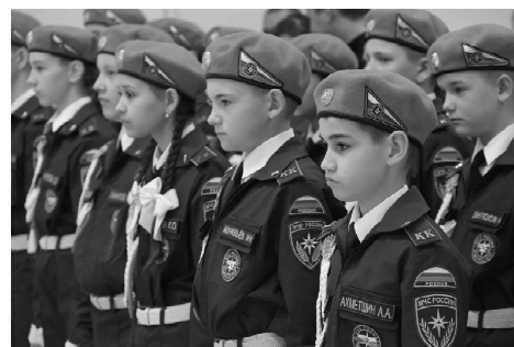
В 2023 и 2024 годах в Омутинском районе были открыты кадетские классы МЧС России, сформированные из 39 ребят 5-х классов