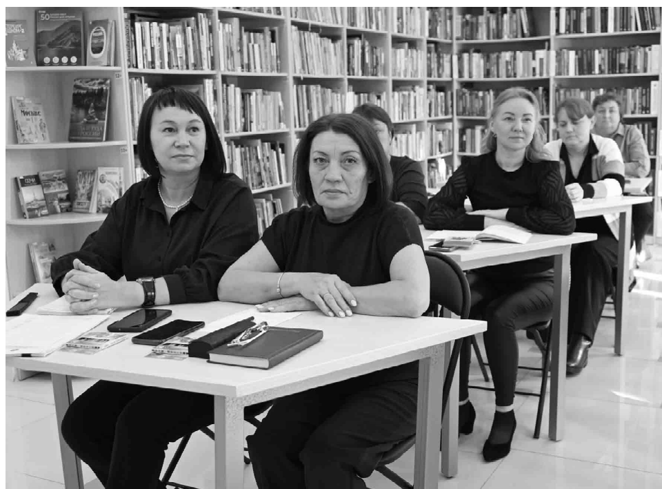
Педагоги-психологи рассмотрели алгоритмы работы с клиентами, страдающими посттравматическим синдромом