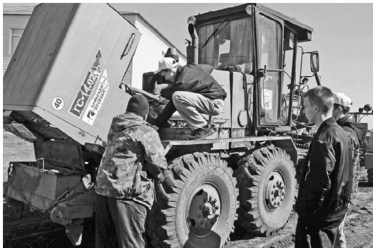
➤ Рассказ о сельхозтехнике

На мероприятие были привлечены работодатели трёх направлений, по которым будет осуществляться набор абитуриентов. В числе работодателей ТОДЭП № 5, социальный партнёр техникума «Племзавод «Юбилейный» и представитель малого бизнеса (кафе «Император»). Для будущих студентов подготовили мастер-классы, где