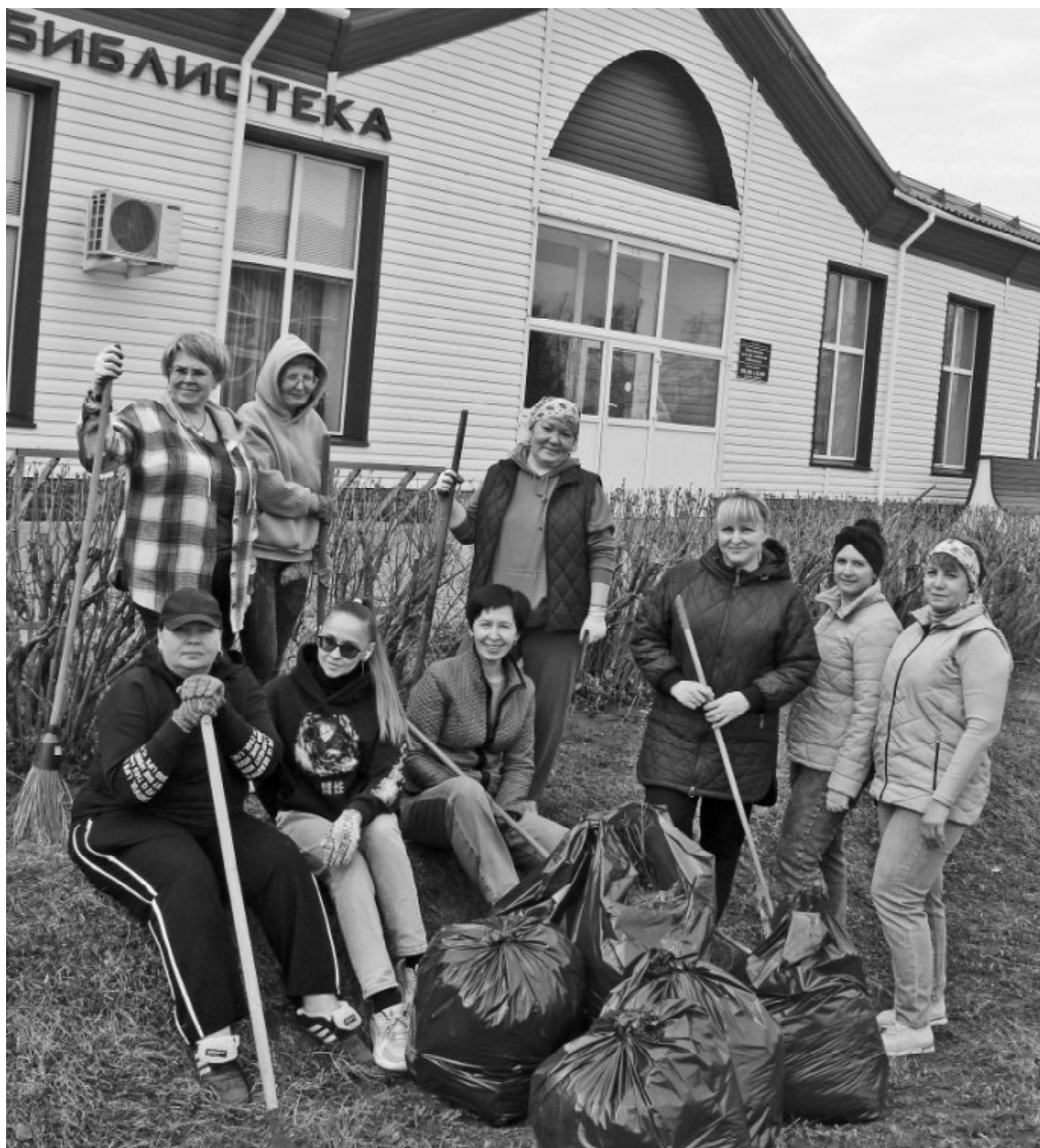
➤ Коллектив Викуловской библиотеки