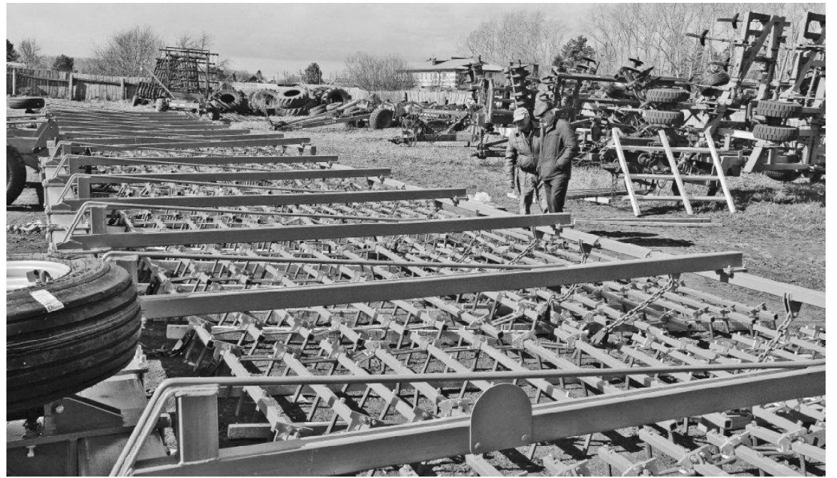
➤ Новая шлейфовая борона ООО «Радиус-агро»