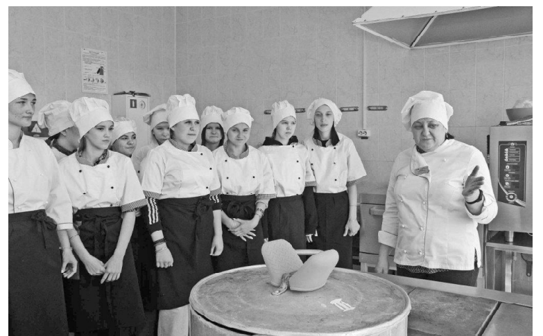
➤ На кухне