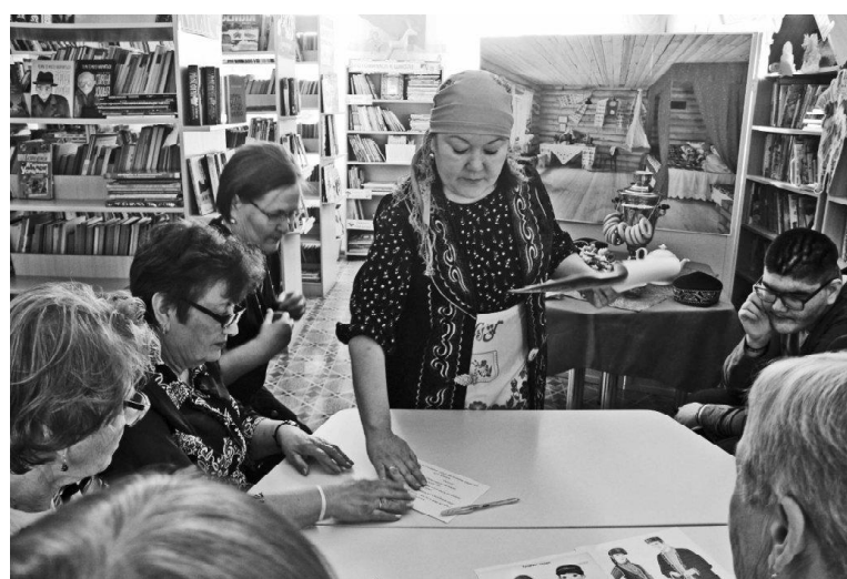
» «Библионочь» // Фото Татьяны СУХОВОЙ