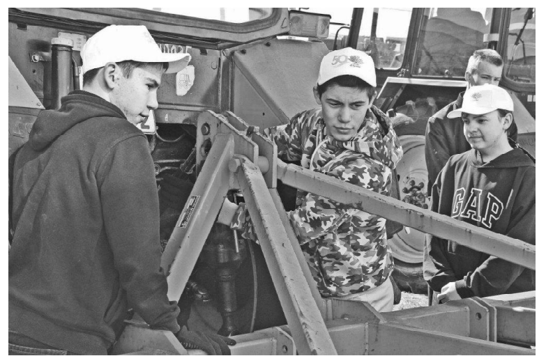
➤ Как устроен культиватор? // Фото Татьяны СУХОВОЙ