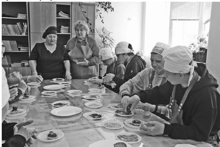
➤ Приготовление десерта

18 апреля в Ишимском многопрофильном техникуме (отделение с. Викулово) состоялся единый всероссийский День открытых дверей. Профориентационное мероприятие прошло в рамках национального проекта «Молодёжь и дети» и федерального проекта «Профессионалитет».