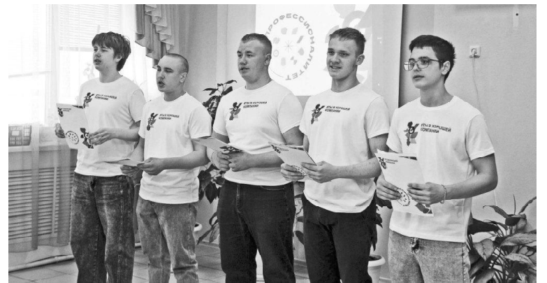
➤ Студенты техникума