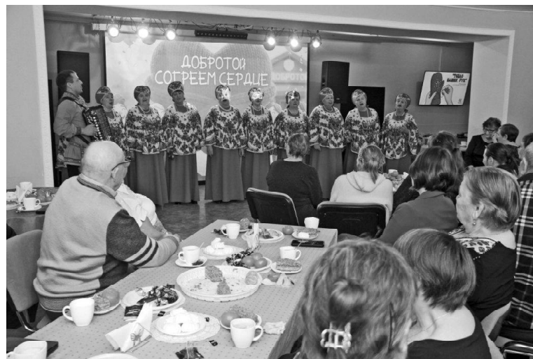
➤ На встрече в РДК