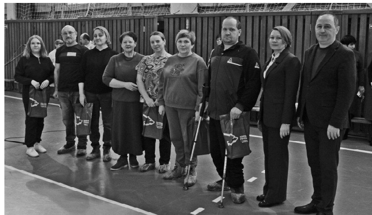
➤ В спорткомплексе