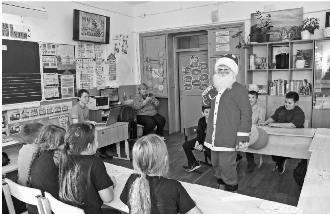
➤ На Дне рождения Деда Мороза, Нововяткинская школа