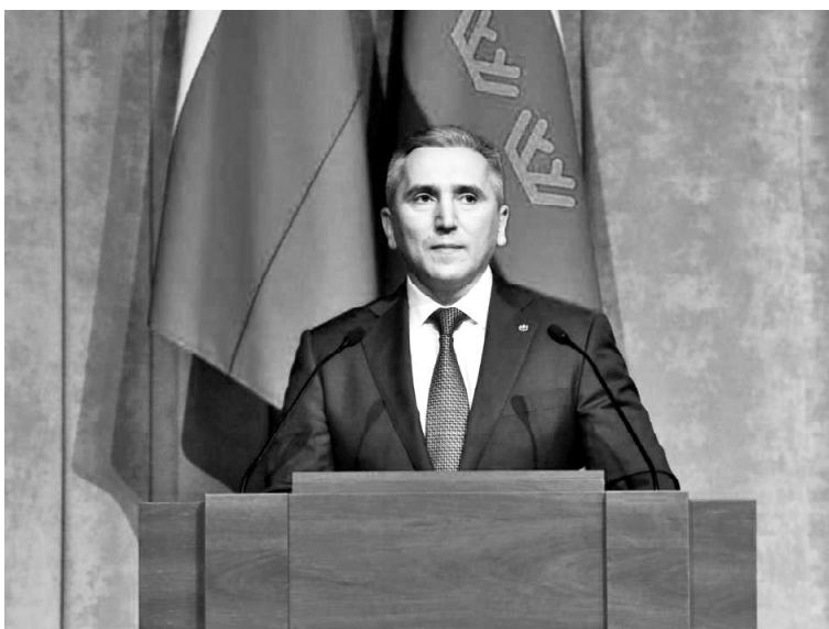
➤ Александр Моор

Напомним, 2026 год объявили Годом единства народов России. Инициативу поддержал президент России Владимир Путин.