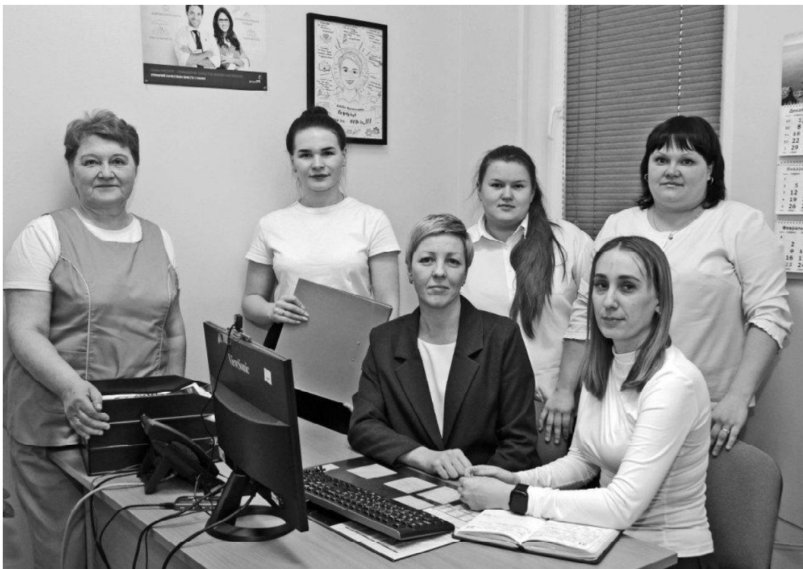
➤ Коллектив Викуловского МФЦ