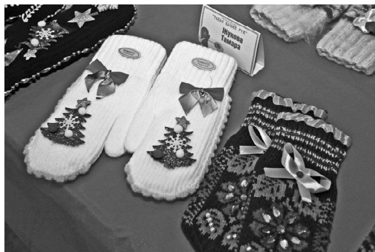
➤ На выставке «Тепло ваших рук»