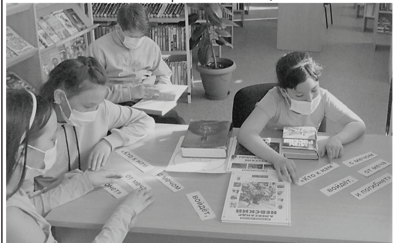
Новоандреевские школьники с интересом изучают историю Отечества.

Олеся МАЛЬЦЕВА, библиотекарь Новоандреевской сельской библиотеки.