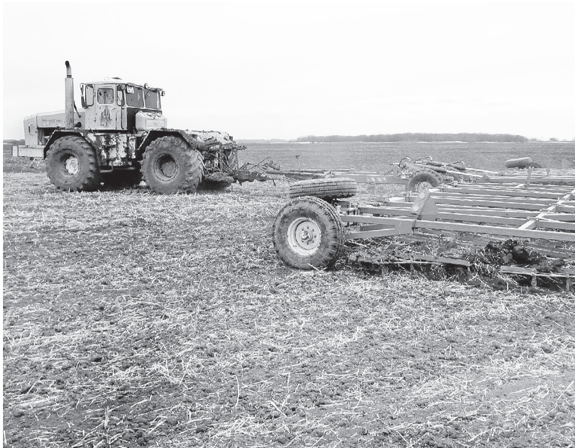
Техника СПК «Таволжан» бороздит сладковские поля.

Несмотря на то, что кое-где на полях и в лесах ещё виднеются островки снега, специалисты сельскохозяйственной сферы открыли полевой сезон. 17 апреля сотрудники кооператива приступили к раннему весеннему боронованию полос.