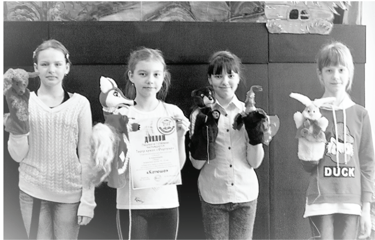
Юные театралы в числе призёров.