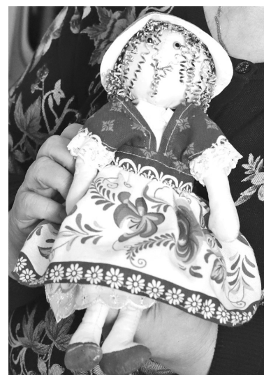
Любимая самодельная кукла Гжелка