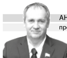
АНДРЕЙ ХОДОСЕВИЧ председатель Тобольской городской думы

Дорогие тоболяки! Поздравляю вас с важным государственным праздником – Днём России, который мы ежегодно отмечаем 12 июня.