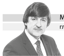
МАКСИМ АФАНАСЬЕВ глава города Тобольска

Дорогие земляки! Сплочённость, взаимная поддержка и консолидация усилий поможет нам справиться со всеми вызовами времени и задачами любой сложности. Пусть любовь к Родине, вера в светлое будущее, профессионализм, ответственность и самоотдача помогают вам твёрдо идти к поставленным целям и достигать успеха, вдохновляют на новые свершения и победы на благо Тюменской области и России!