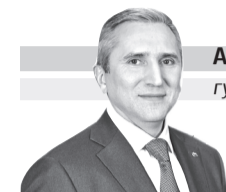
АЛЕКСАНДР МООР губернатор Тюменской области

Уважаемые работники и ветераны автомобильного и городского пассажирского транспорта!