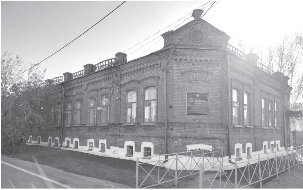
Объект культурного наследия – ул. Пушкина, 33

Она отметила, что сегодня в музее при центре сибирско-татарской культуры собрана достаточно объём-