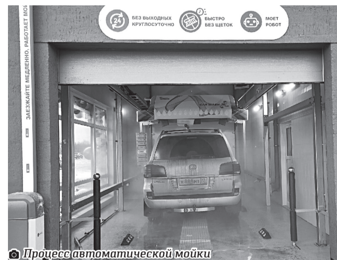
▲ Процесс автоматической мойки