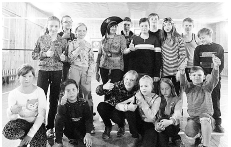
«Остров сокровищ» – это круто!» – такую оценку игре дали ребята