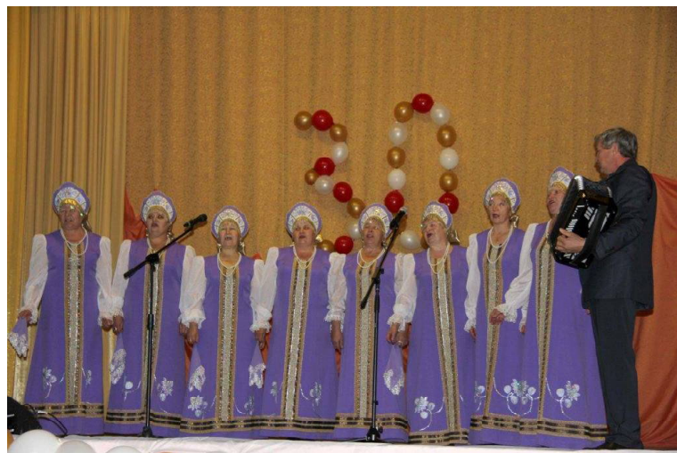
➤ «Завалинка» на сцене

25 октября ансамбль «Завалинка» из Каргалов, один из лучших в районе, встретил знаменательный юбилей. Что такое тридцать лет для коллектива? Это не просто круглая дата, а годы огромного труда участников, целая жизнь. Сейчас в группе девять человек, дружно идущих с песней по жизни. Для них репетиции — это важный момент, концерт — святое. Ради них откладывают домашние дела, берут отгулы на работе. И так, вот уже три десятка лет, продолжают нести частичку культуры от старшего поколения к молодому, дарят радость простой русской песни односельчанам, делятся любовью к малой родине.