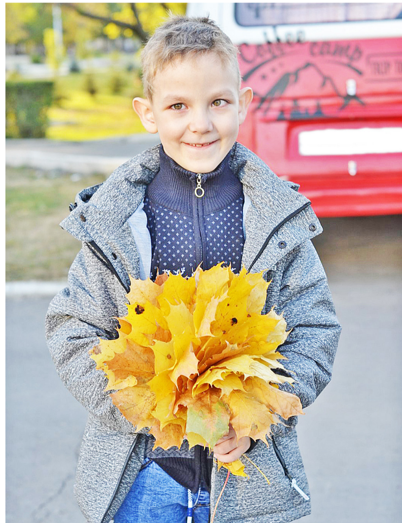
Дети – самые непосредственные и благодарные люди на свете

Мы так быстро привыкаем к хорошему! А ведь достаточно вспомнить наших прабабушек, чтобы ежедневно говорить спасибо создателям посудомоечной и стиральной машин. Стоит только начать практиковать благодарность, как мир вокруг меняет краски, становясь ярче. Одно из первых изменений, которое сразу же бросается всем в глаза, – улучшение настроения не только у вас, но и у того, кому была адресована благодарность. Чтобы сделать окружающих людей чуточку счастливее, просто достаточно