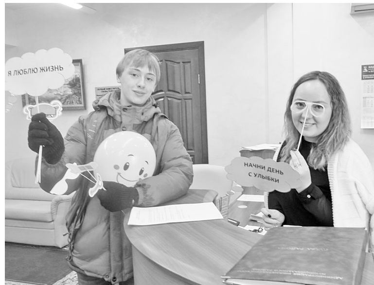
Волонтеры «раздали» шары и «улыбки» всем! Побывали и в центральной библиотеке!

Участники и гости праздника посетили инклюзивные площадки: поучаствовали в мастер-классах, где совершили путешествие по Интернету, узнали, что такое жестовый язык и письмо методом Брайля, поиграли в настольные интеллектуальные игры, вместе с профессиональным шеф-поваром попробовали свои кулинарные возможности, занимались пластилинографией – лепили дом своей мечты. Самое интересное, что всё это пришлось делать с завязанными глазами. Как ещё понять мир