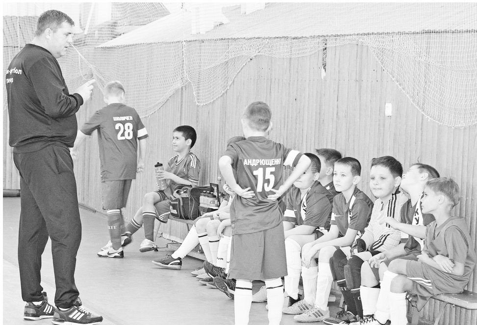
Перерыв. Наставления тренера.

В течение первого этапа Кубка губернатора Тюменской области в пяти матчах нижнетавдинские футболисты сумели