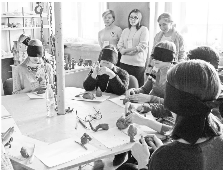
Слепить дом своей мечты с повязкой на глазах возможно? Попробовали. Оказалось – вполне!

В этом году Тюмень вместе с Челябинском, Санкт-Петербургом и Набережными Челнами впервые присоединилась к Международному празд-