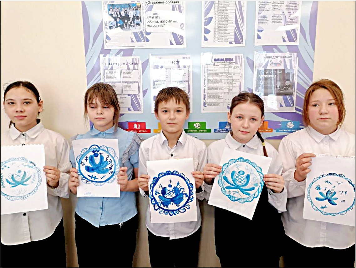
Школьники 4 «В» класса попробовали нарисовать гжельские орнаменты.

31 января в России отмечался День гжели. Учащиеся 4 «В» класса узнали историю возникновения народного ремесла, процесс создания изделий, познакомились с видами и техникой гжельской росписи, с примерами изделий в технике гжель. Ребята научились простейшим приёмам и узнали основные мотивы гжели. У каждого получилась своя уникальная работа, но все «произведения искусства» были объединены традиционным гжельским настроением.