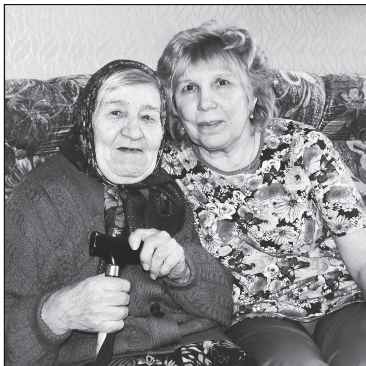
С заботой и вниманием