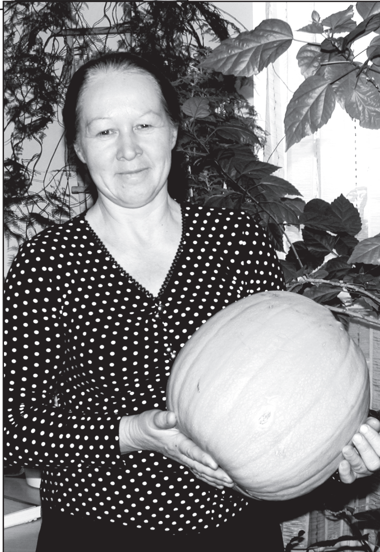
Любимое место отдыха – приусадебный участок