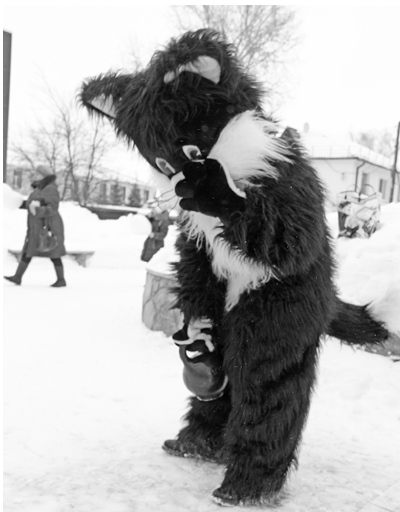
* Коту - Масленица.