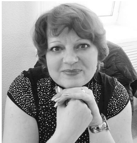
Автор текста: Елена ДАНИЛЬЧЕНКО