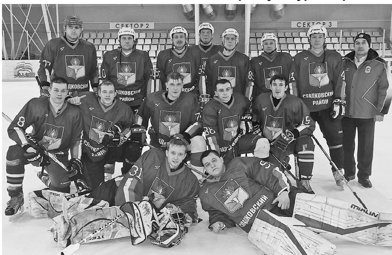
* Сладковская хоккейная команда

Беседу вела Елена ДАНИЛЬЧЕНКО