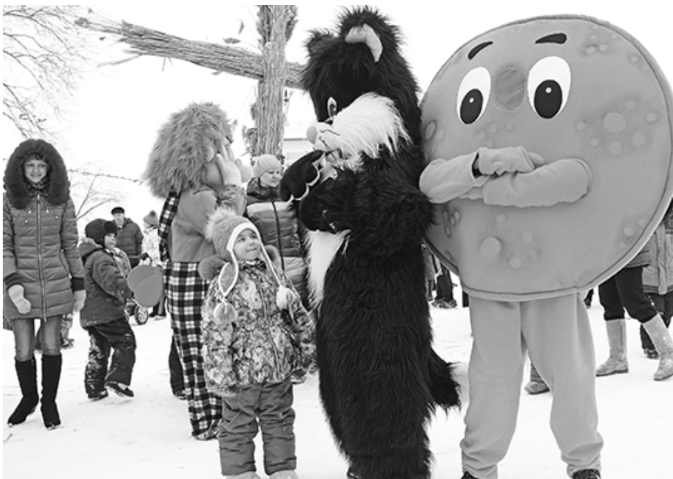
* Масленичные гуляния