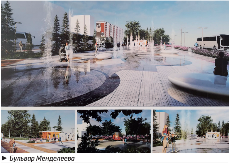
► Бульвар Менделеева

Сад – участок, где пересекается несколько пешеходных направлений микрорайона. Проектом предусматривается не стандартное наполнение, какое есть во дворах с горочками и батутами. Здесь будут преобладать декоративные кустарники и деревья. Изюминкой сквера станет арка, где будут подвешены колокольчики. В продолжении аллеи разместится лабиринт из геопласти-