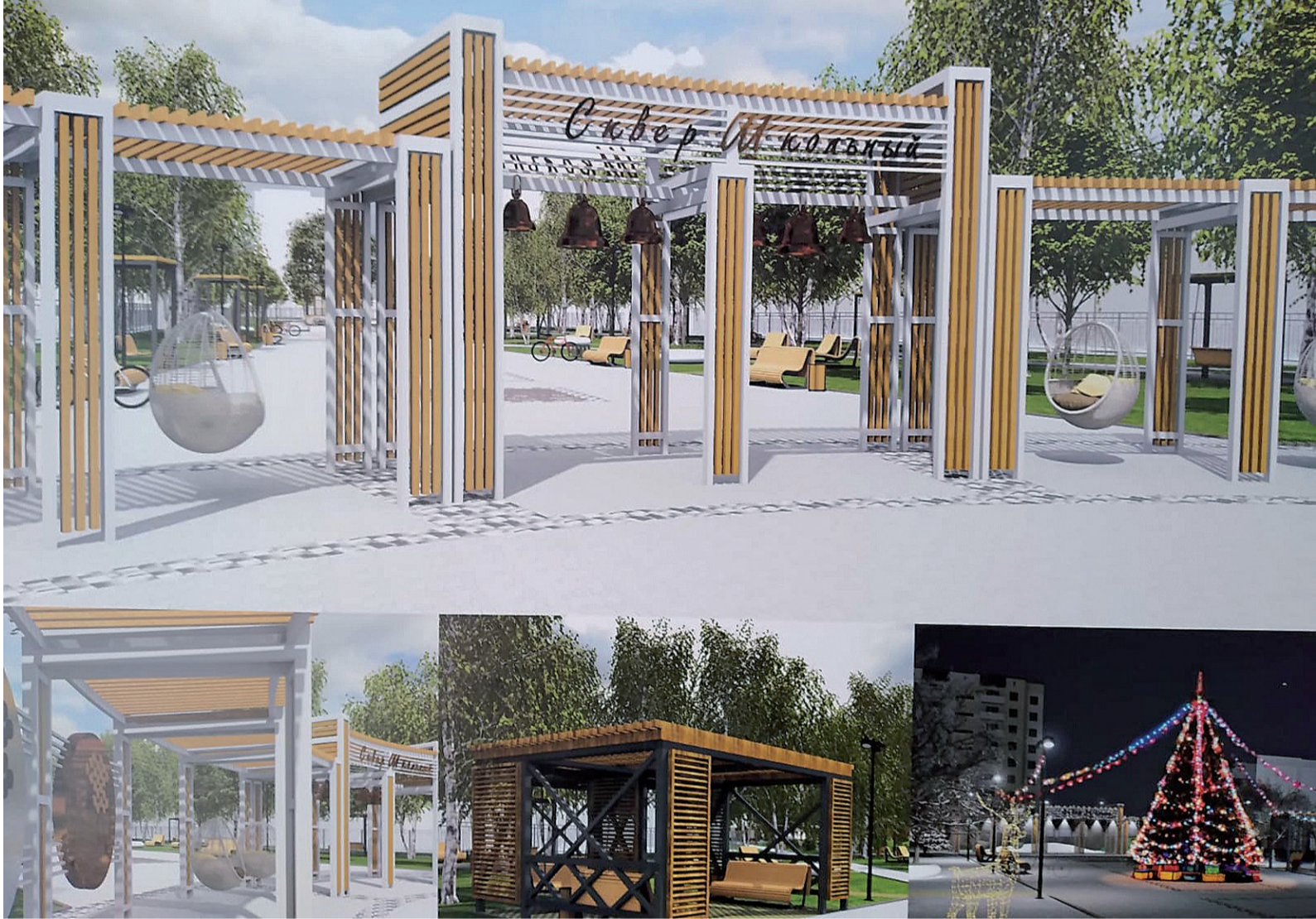
► Сквер Выпускников

Появление сквера Выпускников внесёт и коренные преобразования в территорию школы №7. Концепция её благоустройства будет называться «Семья» – это значит, ученики и их родители. Это значит, разделение её территории на семь участков. Наполнение территории продумано до мелочей. Здесь зона отдыха для старшеклассников и детская игровая площадка для 1-4, 5-8 классов, здесь целый комплекс спортивных площадок, а также модульная раздевалка,