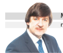
МАКСИМ АФАНАСЬЕВ глава города Тобольска

Желаю хорошо отдохнуть, набраться сил, получить яркие позитивные впечатления и эмоции, с пользой и интересно провести свободное время! С праздником!