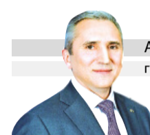
АЛЕКСАНДР МООР губернатор Тюменской области

В этот день мы хотим рассказать вам о поколении юных тобольков, преуспевших как в творчестве, так и в военно-патриотическом движении.