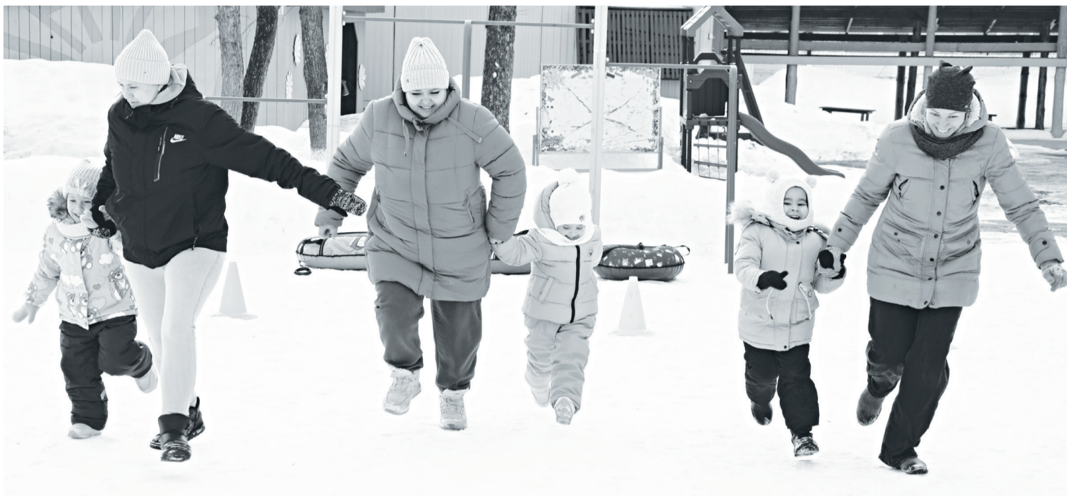
Конкурсантки стартовали в этапе «Мы дружные в парах».

Все участницы очень старались победить. Они преодолели этапы весело, с задором. Любые соревнования предполагают победителей и про-