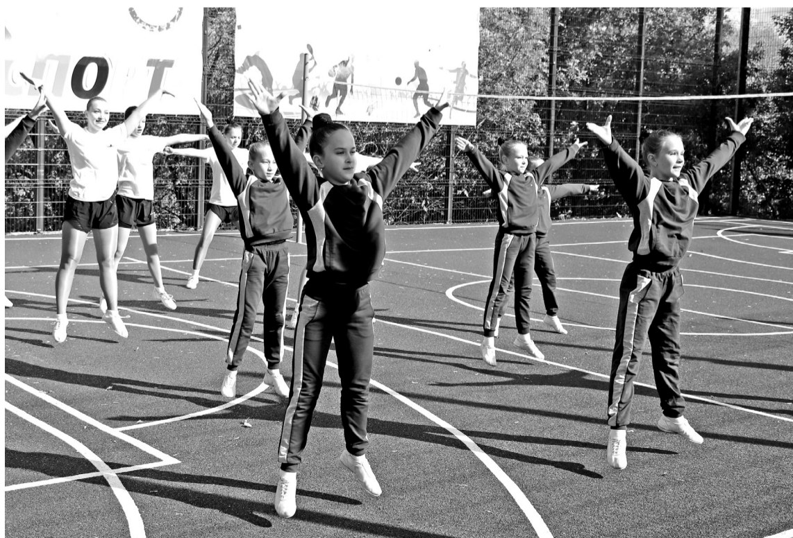
• Открытие обновлённой спортплощадки в школе № 1 города отметили ярким выступлением воспитанницы заводоуковской спортивной школы.