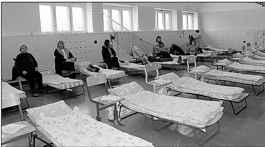
В пункте временного размещения.

ли практические действия по ликвидации чрезвычайной ситуации. Жителей затопляемой зоны оповестили о вероятности ЧС и на автобусах вывезли в пункт временного размещения, расположенный в здании средней школы, который полностью готов принять людей.