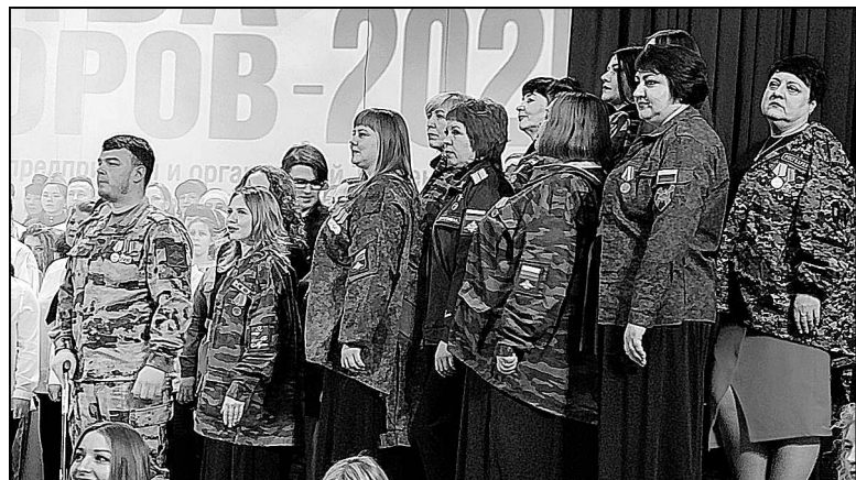
В «СВОей семье» из Каскары – участник СВО, жены, матери, сестры бойцов.