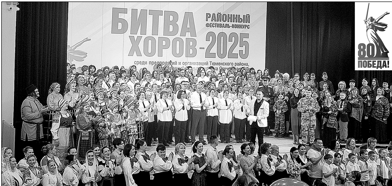
Хорам «столичного» было тесно на сцене: 400 человек приняли участие в фестивале – 2025.