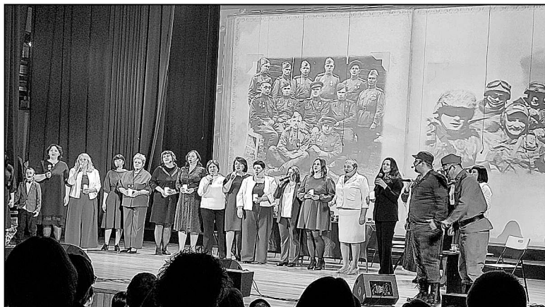
Первые аплодисменты достались богандинскому хору «Интрига». Звучит песня «Герои».