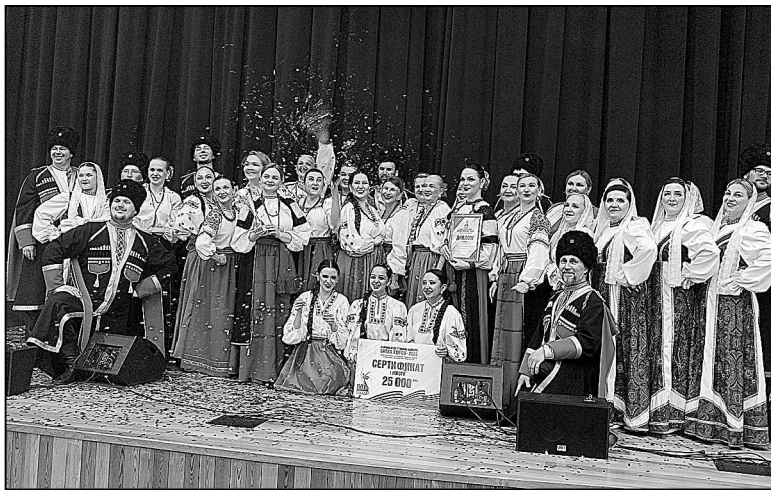
Самым многочисленным был хор из Онохино.