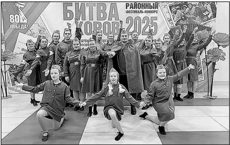
Новотарманский хор «Созвездие» – обладатель второго места.