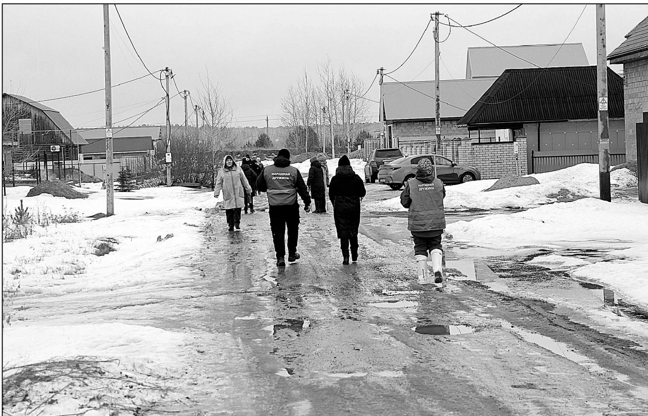
Дружинники оповестили жителей Червишево о подъеме воды.