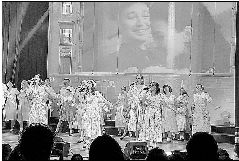
Хор «Единое целое» из Винзилей заслужил Гран-при фестиваля.

Открыл концерт хор «Интрига» Богандинского сельского поселения песней «Герои». Впрочем, это была не просто песня, а целое представление, в котором члены большой семьи из нескольких поколений доказывали мальчишке, уткнувшемуся в смартфон, как важно хранить память о былом, как важно знать, какой ценой достигается мир. «Интрига» заслужила первые аплодис-