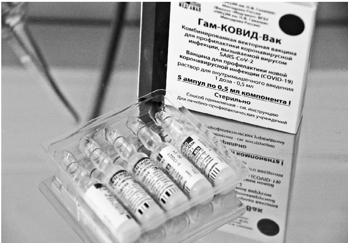
➤ Вакцина — в поликлинике