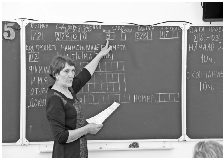
➤ Пункт «Математика»

«Мама, папа, я – интеллектуальная семья». Так называлась региональная акция, которая проходила с 22 марта по 2 апреля во всех муниципальных районах Тюменской области.