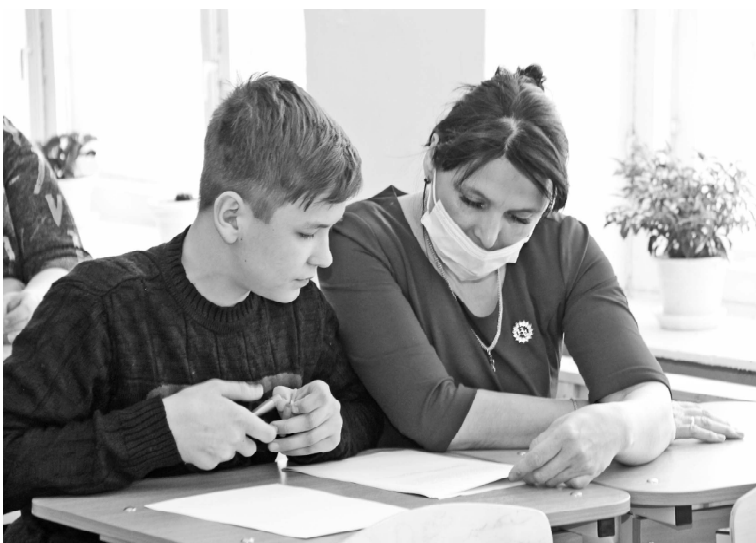
➤ Семья Большаковых решает задание по истории

проходит регистрация участников в имитационном пункте сдачи экзаменов, как организуется рассадка участников в аудиториях, как выглядят рабочие места участников оценочных процедур, как заполняются бланки. Ну и, конечно же, попробовали свои силы в написании самих работ. Объём их был сокращён. Вместо 20 вопросов решали только три. Времени для выполнения заданий отвели немного – 30 минут. Все они были составлены на основе аналогичных тем, которые будут на предстоящих экзаменах.