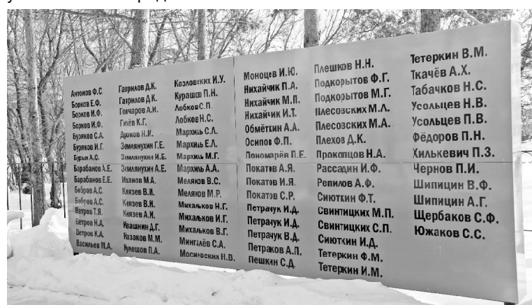
Новая стела в Рябово

• Викулово – 330: «Ребята с нашего двора»