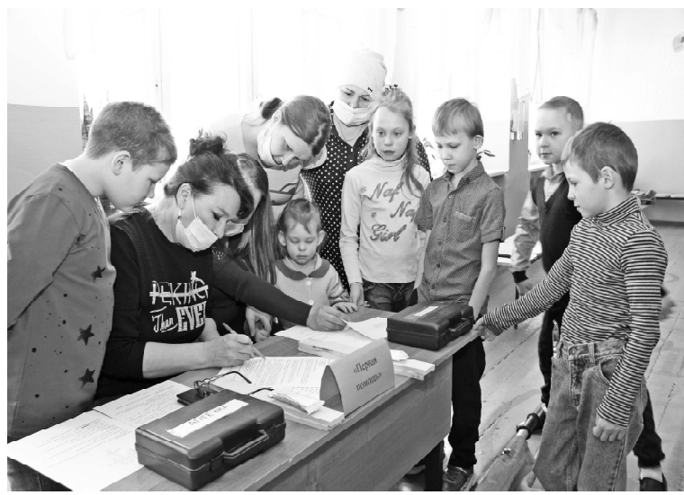
➤ Момент квеста

С первых минут мамы и папы, став участниками необычного фестиваля, прошли тем же маршрутом, который вскоре предстоит пройти их детям, ведь близится конец учебного года. На собственном опыте они увидели, как