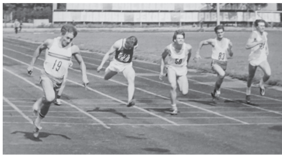
Уверенная победа на одном из стартов, №19