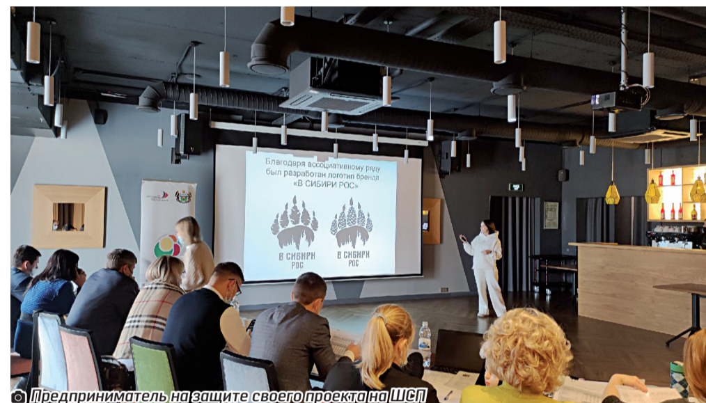
Предприниматель на защите своего проекта на ШСП

платьев, есть даже шапки-ушанки и варежки. Причём изделия из этой ткани (футера) и практичные, и все-сезонные (есть на летний, осенне-весенний и зимний периоды), что весьма свое-