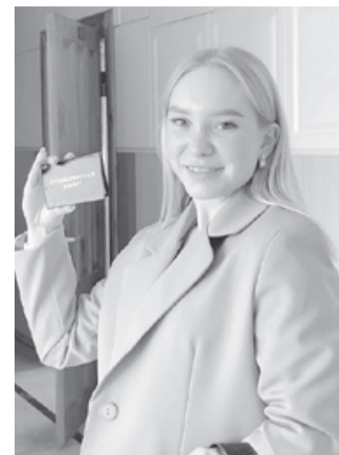
|| Фото из личного архива

Татьяна считает, что математика – наука, которая связана с любой сферой нашей жизни. Она уверена, что влюбить в неё ребёнка можно, но, к сожалению, не каждому дано знать её на «отлично». Самое элементарное, это, наверное, использование на уроках не просто скучных задач из учебника, а тех, что связаны