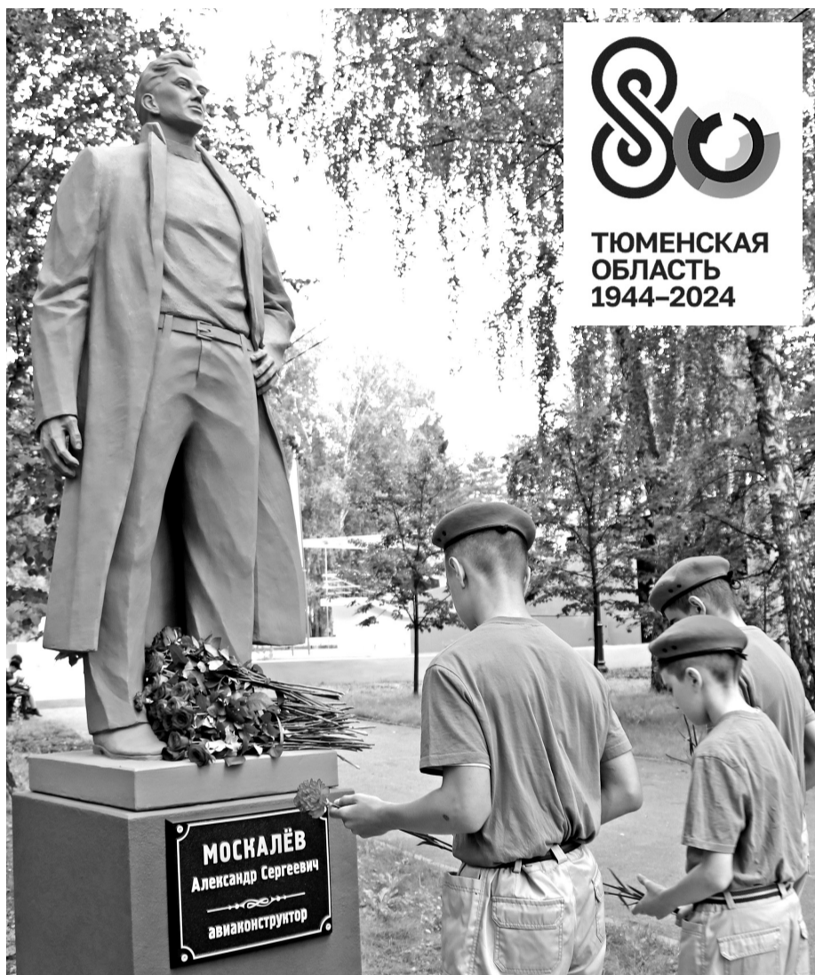
• Цветы к памятнику авиаконструктору Александру Москалёву возложили юнармейцы и курсанты групп добровольной подготовки к военной службе.

Памятник авиаконструктору Александру Москалёву открыт в парке машиностроителей в Заводоуковске