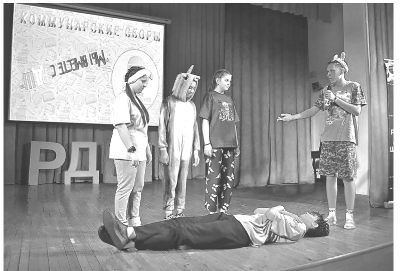
Творили и вытворяли: что могли и как могли

Два выходных дня в Голышмановском молодёжном центре проходили коммунарские сборы «Мы вместе с РДШ».