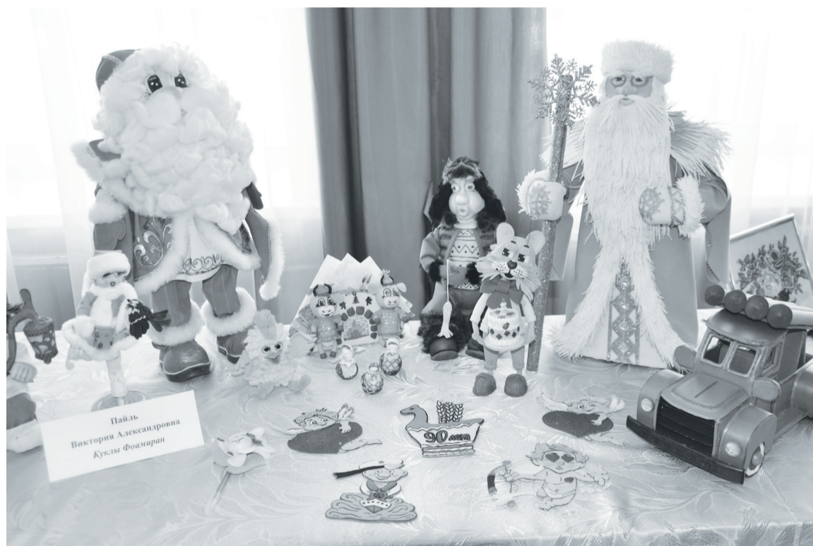
На выставке представлены изделия декоративно-прикладного творчества Виктории Пайль.