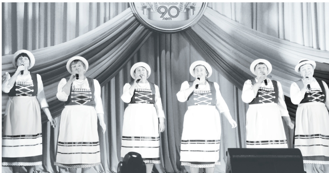
Ансамбль «Wir sind zusammen» – постоянный участник всех мероприятий.

«Я люблю свою землю», – под таким названием торжественное мероприятие, посвящённое 90-летию Упоровского района, как мы уже писали в нашей газете, проводится во всех сёлах района. На этой неделе праздник прошёл в Бызово, Скородуме и Суерке, где концертный зал сельского Дома культуры был полон представителями разных поколений жителей поселения.