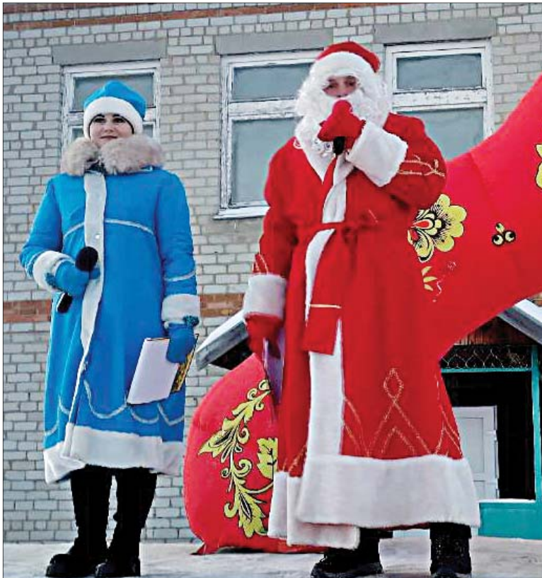
• На новогодней ярмарке сельчане под поздравления Деда Мороза и Снегурочки активно закупились к праздничному столу.

зажигательно исполнила песню о новорожденном снеге, а торговля под мелодичные мотивы пошла, несмотря на морозец, резвее.