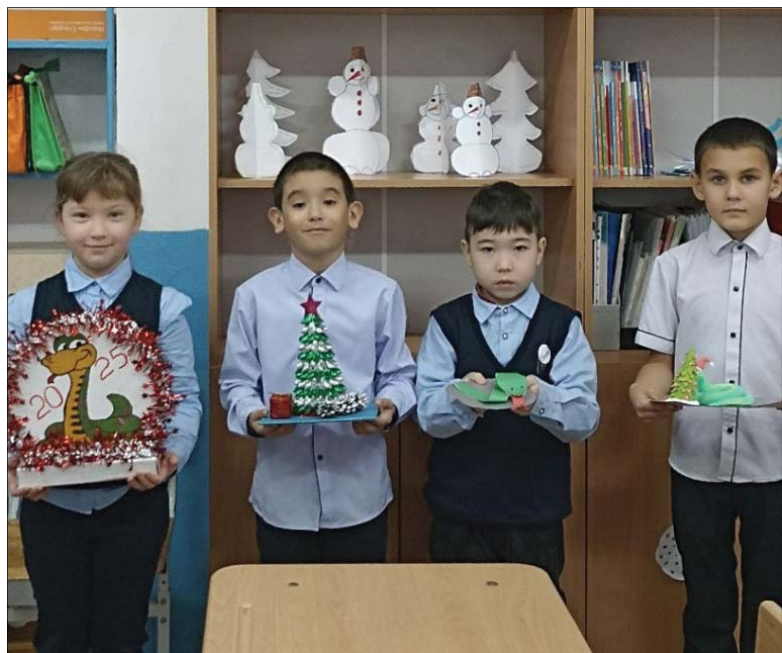
Для учащихся начальных классов Аромашевской школы провели очередное занятие «Орлята России» – трек «Орлёнок-мастер». В этот день была организована увлекательная программа, посвящённая теме мастеров. Ребята не только узнали о значении этого слова, но и получили возможность проявить свои творческие способности. Дети окунулись в атмосферу волшебства, напоминая всем о приближающемся Новом годе. Их ждал интересный мастер-класс, который вдохновил на создание уникальных новогодних домиков для Деда Мороза. Каждый участник проявил свои фантазию и креативность, используя различные материалы и техники. Ребята не только научились чему-то новому, но и изготовили красивые сувениры, украшения для праздника. Тёплая атмосфера, дружеское общение и радость творчества сделали это мероприятие незабываемым, укрепив командный дух и дружбу между участниками. В завершение школьники выразили надежду на очередные творческие проекты в будущем.