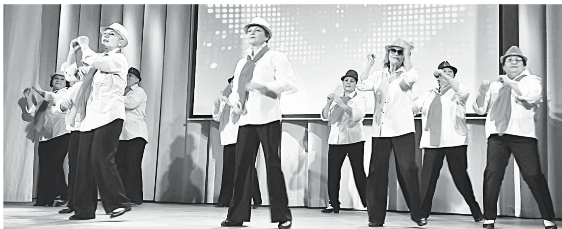
Свой номер представляет танцевальная группа «Стиль» Упоровского РДК.