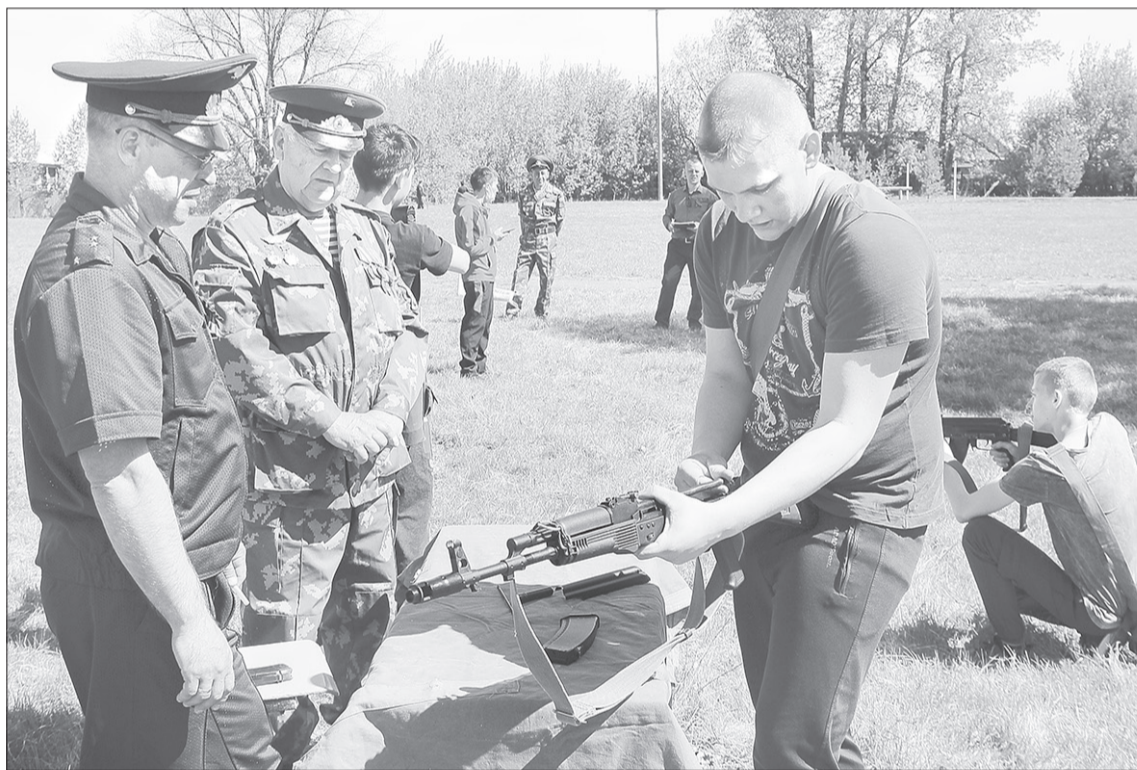
Одно из главных заданий марш-броска - разобрать и собрать автомат