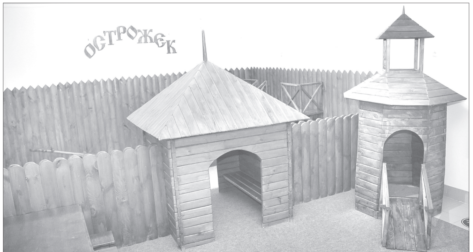
Ко дню рождения города в музее «Торговые ряды» соорудили детскую интерактивную площадку в виде уменьшенной копии острога