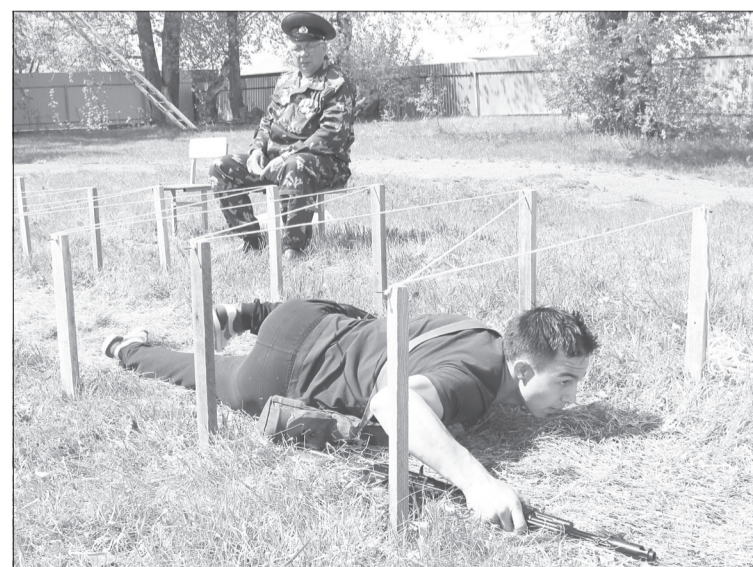
Прохождение этапов игры позволяет ребятам проявить свой характер и показать уровень физической подготовки

Победителям и призёрам Андрей Соломонович и воины-пограничники вручили дипломы, кубки и денежные сертификаты. Лидерами марш-броска стали ребята из Памятного, призёрами - карабашцы и